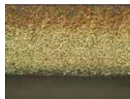
■ 加工後ブレード表面