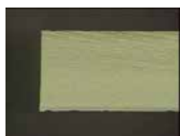
■ ソーマーク(Siウエハ)