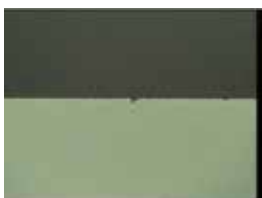
■ 裏面チッピング(Siウエハ)