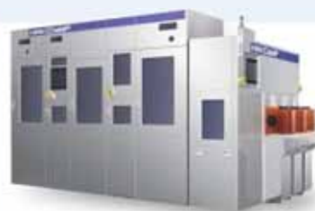
ChaMP332M 12" ウェーハ対応 Dry In Dry or Wet Out 対応