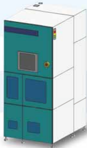
ChaMP311 2" ~ 12" ウェーハ対応 □基盤対応

少量からの Lot 生産に対応いたし ます。 同一プロセス・品質の生産対応で、 市場のニーズ対応にお役立てくだ さい。