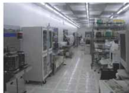
Class 10 測定エリア