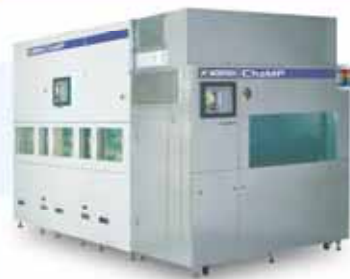
ChaMP232 4" ~ 8" ウェーハ対応 Dry In Dry or Wet Out 対応