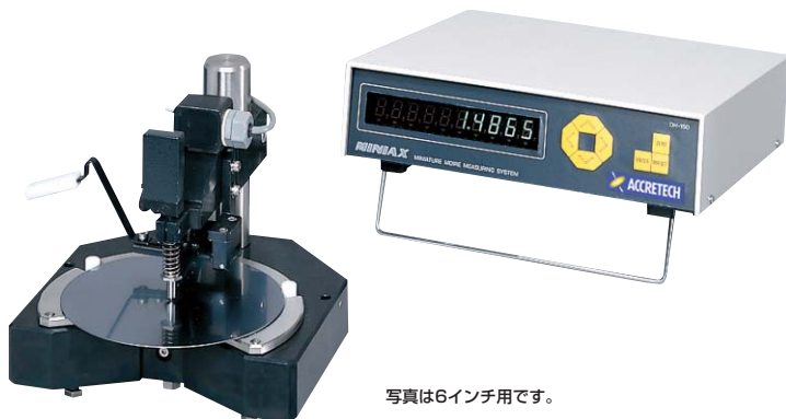
写真は6インチ用です。