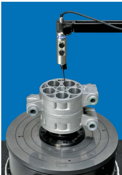
内径の真円度測定例