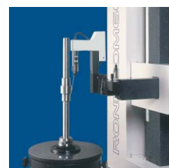
全自動検出器ホルダ (オプション) ※特許出願中